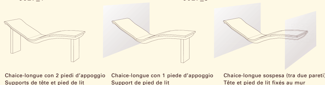
Chaise-longue con 2 piedi d'appoggio Supports de tête et pied de lit

Le Lounger Two délasse grâce à l'unique chaleur rayonnante de la céramique. Son design aérien avec ses surfaces douces et sa forme ergonomique est un bienfait pour le corps et les yeux.