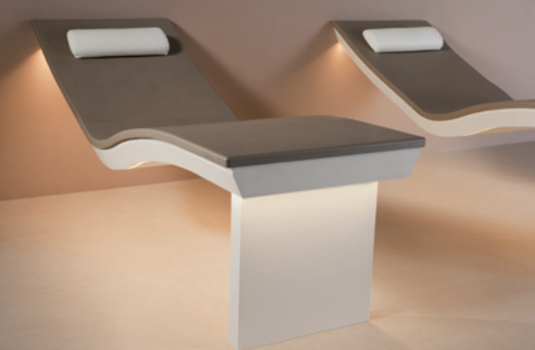
6027_2: Variante con piede d'appoggio indipendente, in smalto agave media Modèle avec pied de lit sur socle, glaçure agave moyen