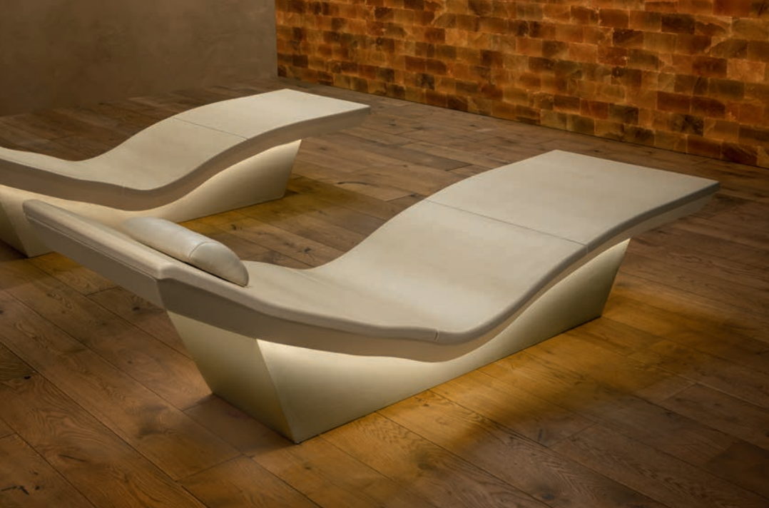
6036_2: Glasur savanne hell / glaze savanna light

Die milde keramische Strahlungswärme mit ihrer einzigartig wohltuenden Wirkung für unser Wohlbefinden, die klare, reduzierte Formensprache und die ergonomische samtweiche Oberfläche des Lounger Two Plus – formvollendete Entspannung.