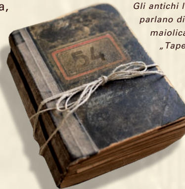
Gli antichi libri Mastro parlano di stufe in maiolica con rilievo „Tapetenmuster“

della Manifattura Ceramica Sommerhuber coniugano una nuova tecnica, caratterizzata da un grande amore per il dettaglio, come nel caso della panca integrata, e la tradizione tipica della produzione di maioliche, per realizzare stufe dal sapore sorprendentemente attuale.