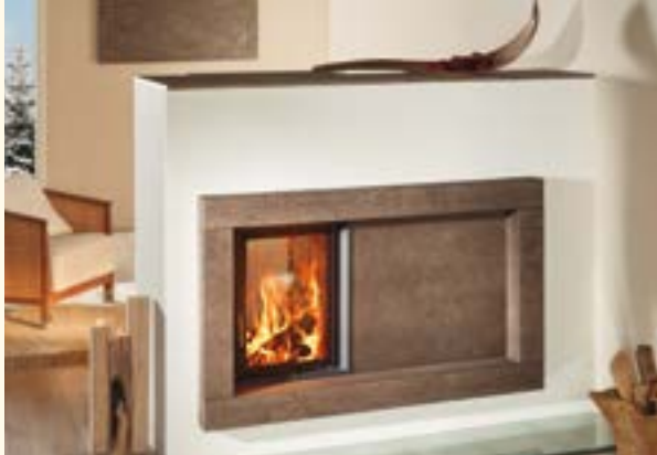
2081_2: Cornice per focolare scanalatura massiccia fine 240, ceramica da parete 224 Smaltatura: Torba scura con struttura Terra Tecnologia: Brunner KE: 125,0