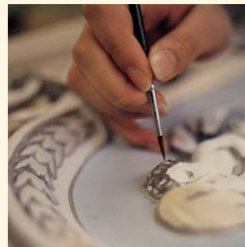
2037: Mattonelle a cornice K 360 Mattonelle a forma di pala K 361 Smaltatura: Verde caccia e Pittura in vari colori Unità mattonella: 265