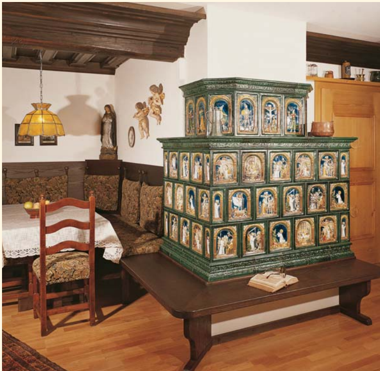
515: Mattonelle „Renaissance“ K 185/187 Smaltatura: Verde scuro opaco e pittura a colori vivaci Unità mattonella: 1288

Una particolare stufa in maiolica è stata dipinta con i motivi della via crucis, un simbolo questo del profondo legame con i valori cristiani. Ancora oggi le immagini vengono realizzate secondo i disegni originali della fine del XV secolo.