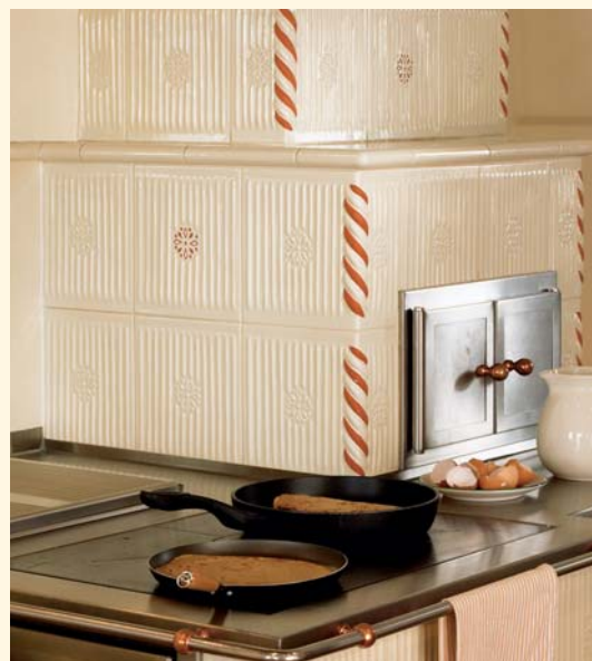
2039: Mattonelle a canne d'organo K 138 Smaltatura: Alabastro Unità mattonella: 592

È un piacere tutto particolare ritrovarsi attorno ad una stufa in maiolica Sommerhuber e cucinare insieme, magari seguendo le ricette della nonna. Quando si spande nell'aria il profumo inconfondibile del pane croccante, di un arrosto succulento oppure dei meravigliosi dolci di Natale, che infonde quell'inconfondibile stato d'animo. Una sensazione unica, che solo una stufa in maiolica Sommerhuber è in grado di diffondere, o meglio di irradiare.