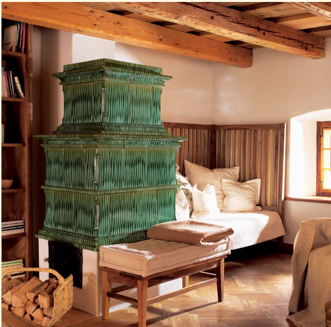
2040: Mattonelle „Barocco“ K 239 Smaltatura: Verde fiammato Unità mattonella: 421