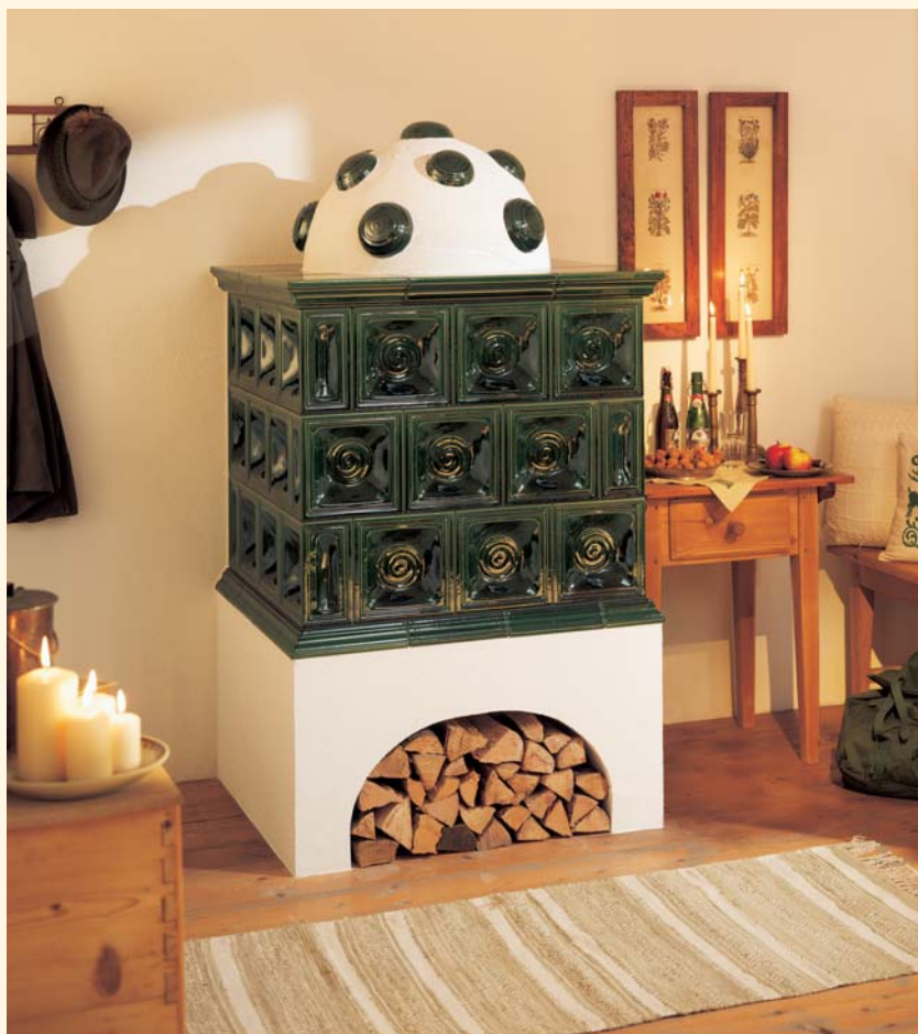
1989: Mattonelle „Chiave“ K 530 Smaltatura: Verde antico Unità mattonella: 217