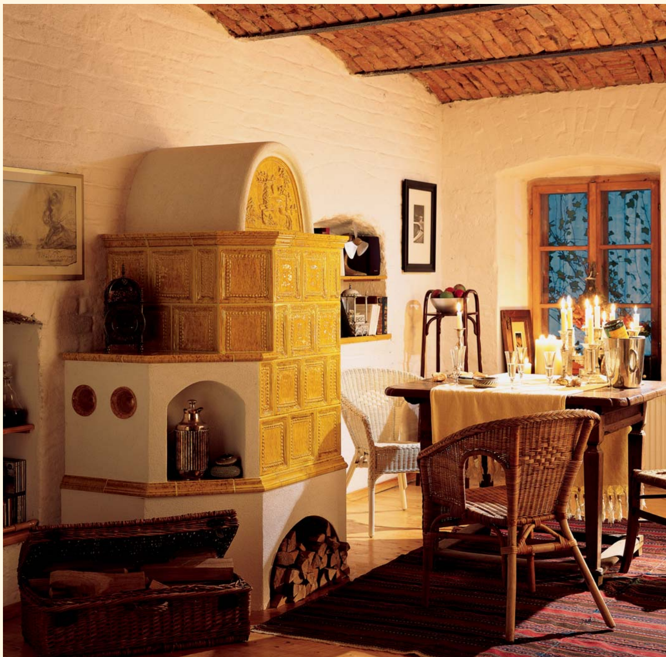
1942: Mattonelle „Renaissance“ K 082 Smaltatura: Miele Unità mattonella: 207