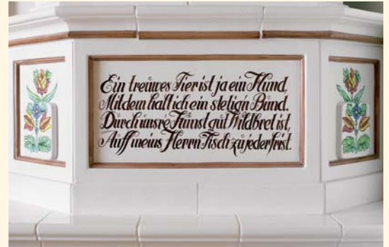
2041: Stufa con scene di caccia K 510 Smaltatura: Bianco incandescente e Pittura in vari colori Unità mattonella: 1409

Una particolare stufa in maiolica è stata dipinta con i motivi della via crucis, un simbolo questo del profondo legame con i valori cristiani. Ancora oggi le immagini vengono realizzate secondo i disegni originali della fine del XV secolo.