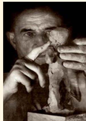
Il Prof. Michael Powolny