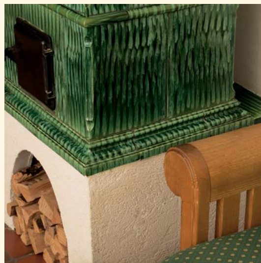
2035: Mattonelle „Barocco“ K 239 Smaltatura: Verde fiammato del 1946 Unità mattonella: 303

La stufa originale in maiolica Sommerhuber riprodotta in questa pagina risale agli anni '40 e si trova all'Hotel Forsthof di Sierning. Solo gli esperti riconoscono nelle piccole sfumature di colore il segno tipico delle stufe di quegli anni.