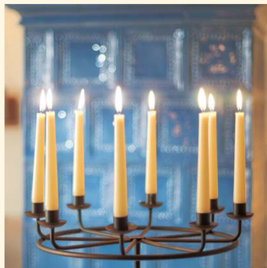
1990: Mattonelle „Renaissance“ K 082 Smaltatura: Genziana Unità mattonella: 280

Una tradizione viva trova ogni volta la sua realizzazione, interpretata in chiave moderna, nel periodo attuale. Proprio come per le stufe in maiolica Sommerhuber, la cui forma è rimasta pressoché identica. Le mattonelle vengono prodotte da cinquecento anni nella stessa identica forma, solo le smaltature sono state adeguate ai tempi moderni. I secoli di storia nella produzione della ceramica a Steyr contribuiscono in maniera determinante alla realizzazione di queste forme antiche ancora oggi. Già nel 1491 infatti, presso lo Stabilimento Sommerhuber di Steyr si producevano stufe in maiolica. Alla fine del diciannovesimo secolo Sommerhuber era fornitore di corte della Casa imperial-regia degli Asburgo Lothringen e della Casa reale dei Sachsen Coburg Gotha. Oltre che per castelli sfarzosi, numerose stufe in maiolica Sommerhuber sono state prodotte anche per le residenze estive del Salzkammergut e per splendide tenute di caccia.