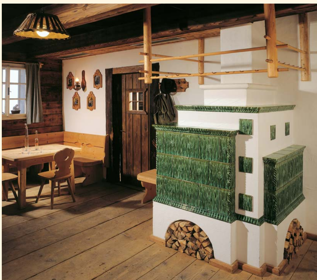
1924: Mattonelle „Canne d'organo“ K 138 Smaltatura: Verde fiammato Unità mattonella: 314

In questi luoghi della casa si dà sempre molta importanza all'alta qualità artigianale. I mobili in legno massiccio locale, la forma ed il design artistico del servizio da tavola e, naturalmente, la smaltatura della stufa in maiolica. Il verde è il colore di maggior tradizione nelle „Stube“ alpine. Il verde infatti è da sempre sinonimo di naturalità, di armonia e di cordialità.