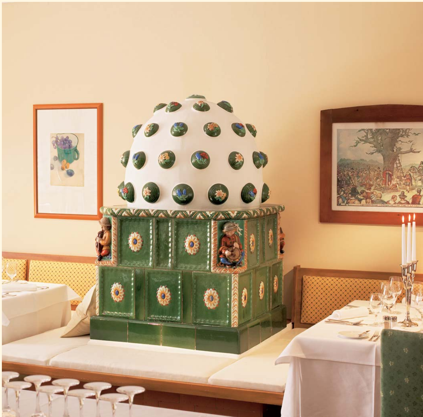
Titolo 2036: mattonelle „Barocco“ K 239 Smaltatura: Verde fiammato Unità mattonella: 388