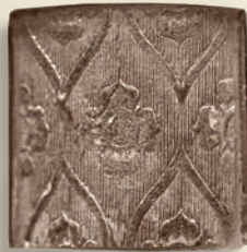
Die Kachel „Tapetenmuster“ im Kachelofenmuseum in Steyr

Die Keramik Manufaktur Sommerhuber schöpft aus ihrer jahrhundertelangen Geschichte, die bis in die Renaissance zurückreicht. Ein wahrer Schatz wurde im Sommerhuber Kachelofenmuseum in Steyr gehoben – die Kachel „Tapetenmuster“ erstmals hergestellt um das Jahr 1570 in Steyr. In der Renaissance waren die Kachelöfen mit dem „Tapetenmuster“ in Jagdschlössern und Bürgerhäusern anzutreffen.