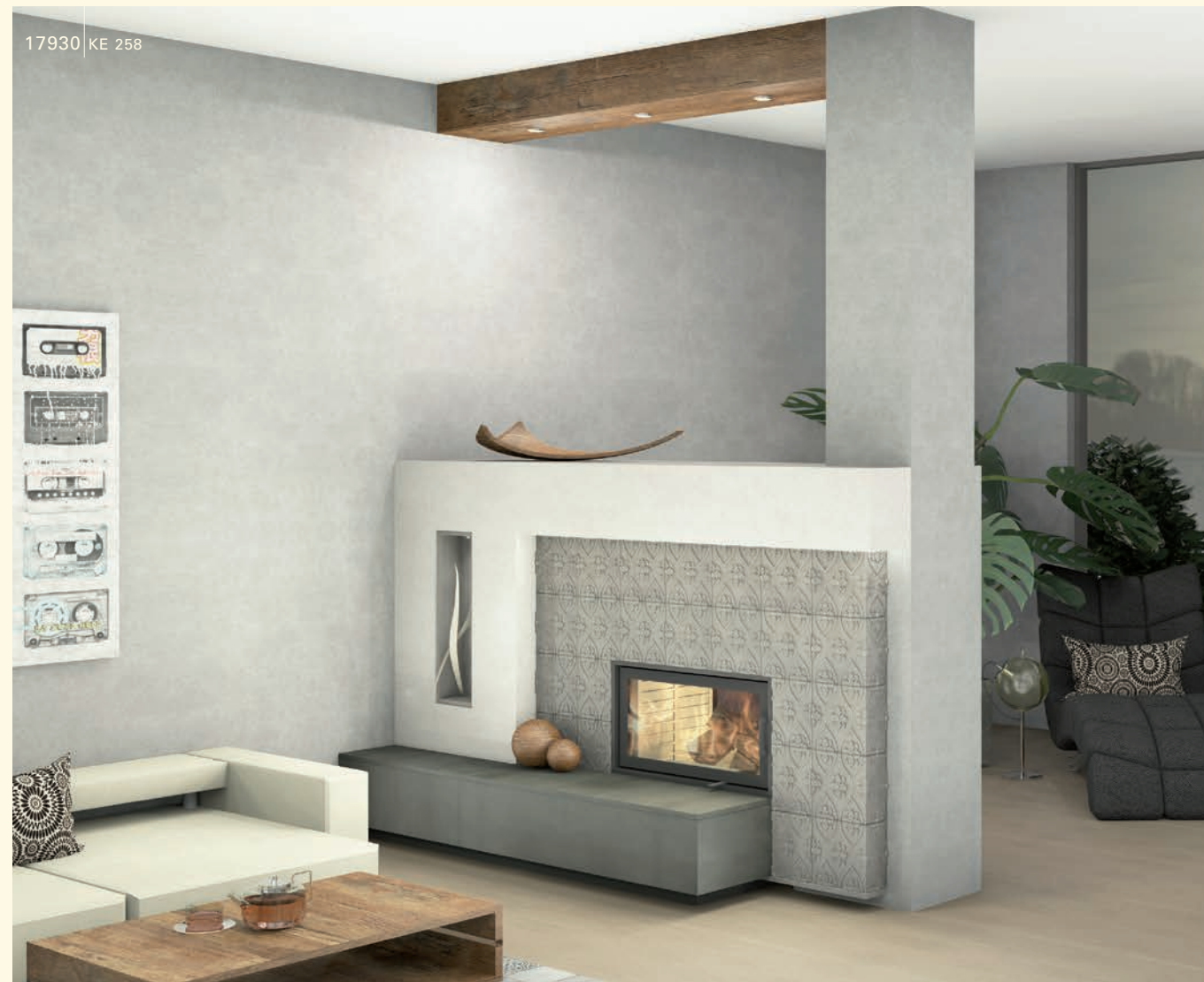
17930 KE 258

Die Planung des Kachelofens oder Kachelkamins der Keramik Manufaktur Sommerhuber orientiert sich an den individuellen Raum- und Platzverhältnissen und natürlich auch an den Wünschen nach Form, Farbe und Oberflächenstruktur. Allen Kachelöfen gemeinsam ist die Behaglichkeit der keramischen Strahlungswärme.