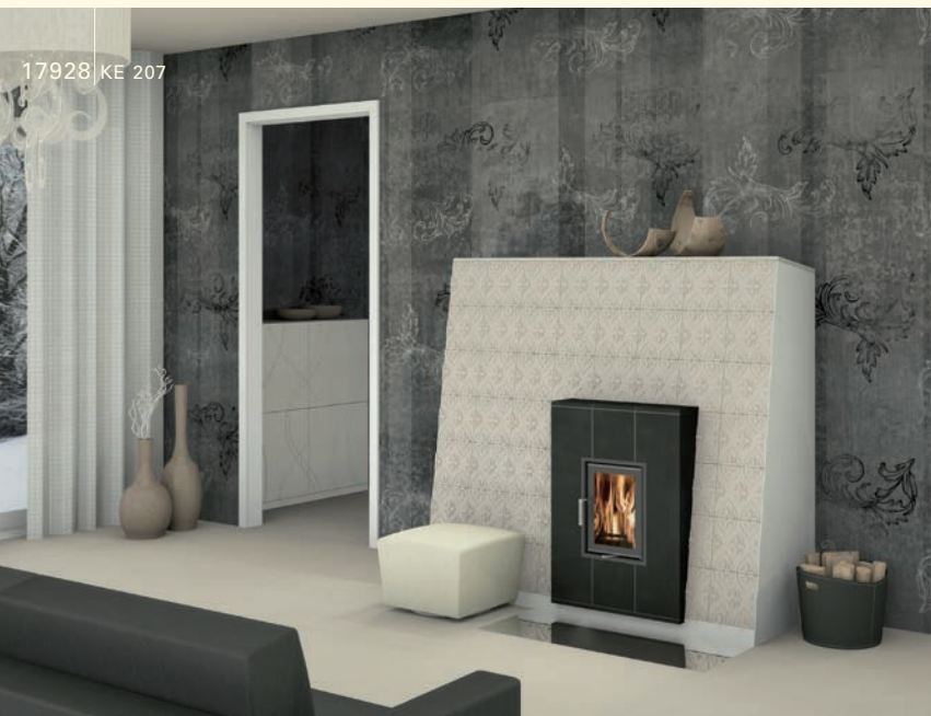
17928 KE 207