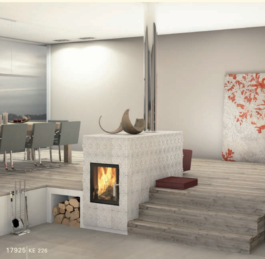
17925 KE 226