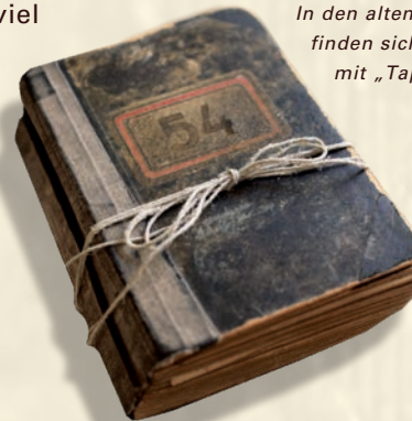
In den alten Auftragsbüchern finden sich Kachelöfen mit „Tapetenmuster“

Aber auch in den 1960er- und 1970er-Jahren waren diese Kacheln im städtischen Bereich weit verbreitet. Die aktuellen Entwürfe der Keramik Manufaktur Sommerhuber verbinden neue Technik mit viel Liebe zum Detail – wie der integrierten Sitzbank – und die Tradition der Kachelherstellung zu einem überraschend zeitgemäßen Kachelofen.